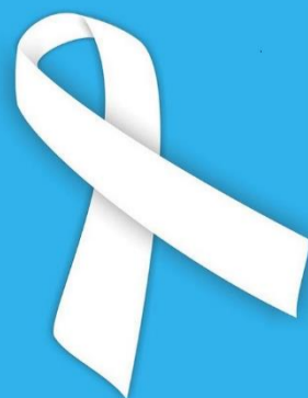
Kampania Biała Wstążka